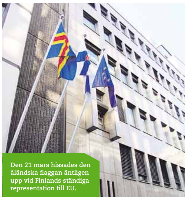
Den 21 mars hissades den åländska flaggan äntligen upp vid Finlands ständiga representation till EU.