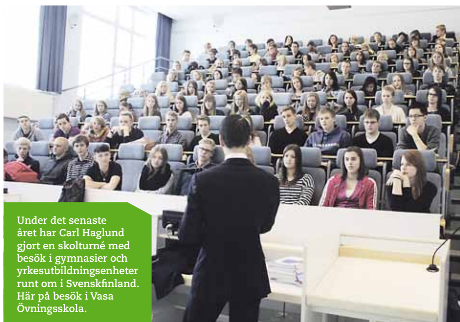
Under det senaste året har Carl Haglund gjort en skolturné med besök i gymnasier och yrkesutbildningsenheter runt om i Svenskfinland. Här på besök i Vasa Övningsskola.