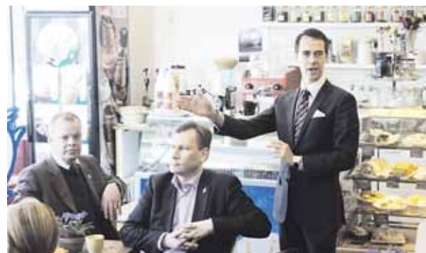
En viktig del av arbetet i Europaparlamentet är besöken runt om i Finland. Här besöker Carl Haglund Lovisa och berättar om aktuella Europafrågor och hur de påverkar stämningarna hemma i Finland.