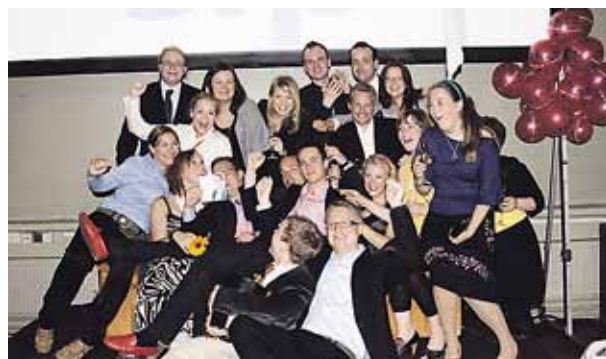
Vi kom nyligen över bilder från valvakan då SFP erövrade en plats i Europaparlamentet. Här firar partiets ungdomsorganisation segern med ett gruppfoto.